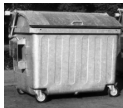
MGB 2500 VR feuerverzinkt, mit Räder für DIN 30738 Aufnahmetaschen/Schüttung