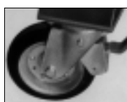
Lenkrollen mit Feststeller

Lieferbar auch - mit spez. Bügel/Öse für Absperrung mit Vorhangschloß