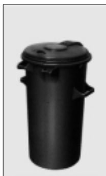
MGB 70 K in Kunststoff ÖNORM S 2013