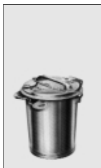
MGB 35 V feuerverzinkt mit Bügel

MÜLLGROSSBEHÄLTER aus Stahlblech, feuerverzinkt mit Schwenckdeckel, von 35 bis 4500 l. Das System für die wirtschaftliche und hygienische Müllabfuhr, nach DIN/ÖNORM (S 2015), passend in alle Schüttvorrichtungen, der Schutz vor Brandgefahr, für Haus-, Gewerbe- und Industriemüllabfälle/Einsammlung, Ausführung als Mülltonne = V ohne Räder. Ausführung rechteckig/gerundet = VR mit Rädersatz, 4 Lenkrollen mit Feststeller