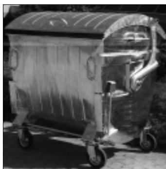
MGB 1100 VR feuerverzinkt, mit Räder für DIN 30700 Schüttung, mit seittl. Zapfen 50 Ø