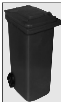
MGB 120 KR in Kunststoff mit Rädersatz