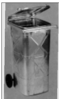
MGB 240 VR feuerverzinkt mit Rädersatz