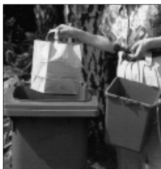
MGB 10 K in Kunststoff für einhängbare Papierkörbe

MÜLLGROSSBEHÄLTER aus Kunststoff-Niederdruckpolyäthylen, beständig gegen Säure, Laugen, Wittereinflüsse etc., mit Schwenckdeckel, färbig, von 10 bis 1100 l. Das System für die Einsammlung von Haus- und Gewerbemüll, UV-stabilisiert nach DIN/ÖNORM, passend in alle Schüttvorrichtungen. Ausführung als Mülltonne/-eimer rund = K ohne Räder. Ausführung rechteckig/gerundet = KR mit Räder. Farben in grün, grau, braun, gelb, rot, orange, auch kombiniert lieferbar.