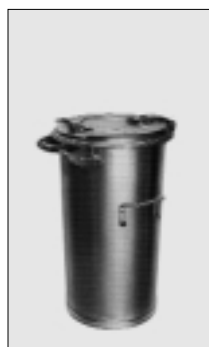
MGB 90 V feuerverzinkt Kammaufnahme