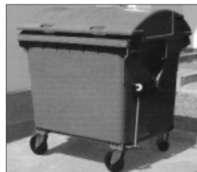
MGB 1100 KR in Kunststoff, mit Räder 4 Lenkrollen mit Feststeller